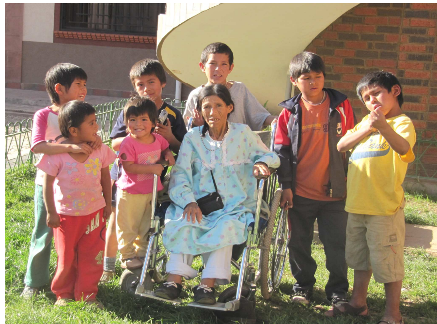
Mama besucht uns im Waisenhaus