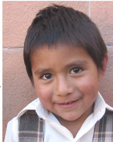
"Fertig" um zur Schule zu gehen

bezieht sich dabei auf einen Lippenstift, den andere Mädchen sich heimlich besorgt und ins Haus gebracht haben.